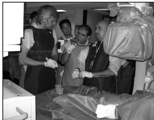
Clase práctica sobre modelos animales durante el VIII Hands-on celebrado en Buenos Aires

Aunque el temario teórico fue extenso y abarcó prácticamente todas las parcelas del Intervencionismo, se debe resaltar el sentido eminentemente práctico de este curso. La enseñanza de las técnicas intervencionistas sobre modelos animales es una herramienta pedagógica insustituible en la formación de cualquier ciencia que fundamente sus conocimientos en las ha-